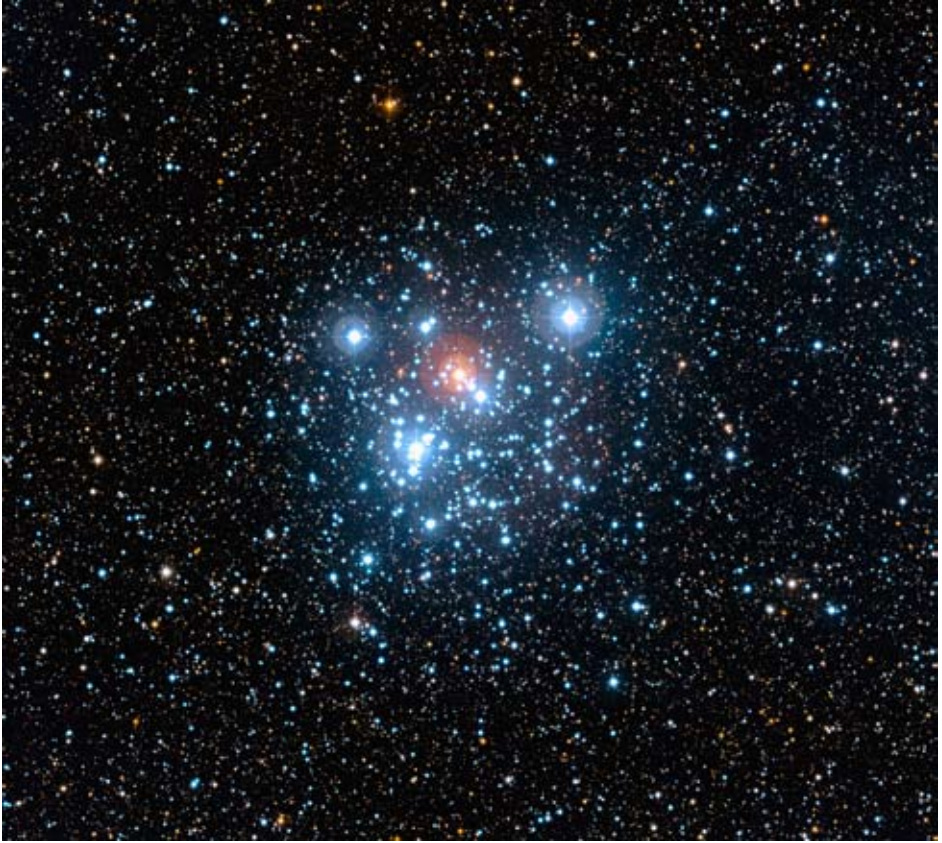
5. Cet amas ouvert (NGC 4755) fut baptisé la Boîte à Bijoux par Nicolas-Louis de Lacaille en 1751/2. Situé à environ 75 000 années-lumière, il rassemble en gros une centaine d'étoiles sur une vingtaine d'années-lumière.

Comment les distinguer facilement ? La vraie Croix du Sud a plutôt la forme d'un cerf-volant avec une cinquième étoile, \epsilon Cru, entre \alpha Cru et \delta Cru. La fausse croix ressemble plus à un diamant et n'a pas de cinquième étoile « en bas à droite ».