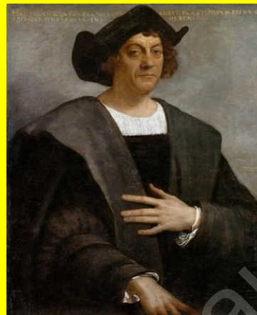
Portrait d'un homme supposé être Cristóbal Colón par Sebastiano del Piombo (1485–1547).

Né Christophorus Columbus (en figure Christoffa Corombo) à une date imprécise en 1451 (ou 1456?) et très probablement à Savona en République de Gènes, ce navigateur fut le premier à proposer de rejoindre les Indes – ou plutôt la côte orientale de l'Asie – en traversant l'Océan Atlantique vers l'Ouest.