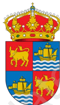
Blason actuel de Baiona. On y remarque l'évocation de la caravelle "Pinta".